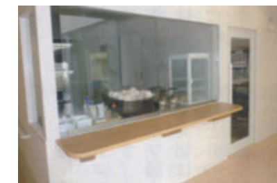
サテライトキッチン

お子さまの健康の保持・増進、疾病の予防・治療を目的として、個々に作成した栄養計画に基づき、適切な栄養量・食事形態の食事を提供しています。病院食のイメージではなく、家庭的な温かみのある食事を心がけ、四季折々の行事食や手作りおやつを提供もしています。また入所病棟にはミニキッチンを設け、料理の音や匂いを感じていただく事で、家庭の雰囲気を感じていただけます。